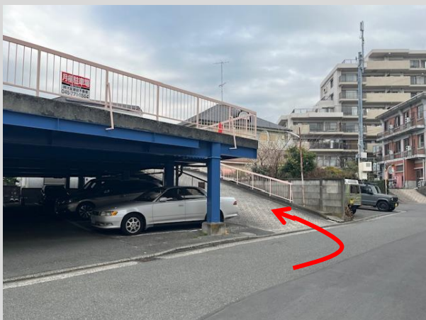
滝頭2丁目駐車場【2階】